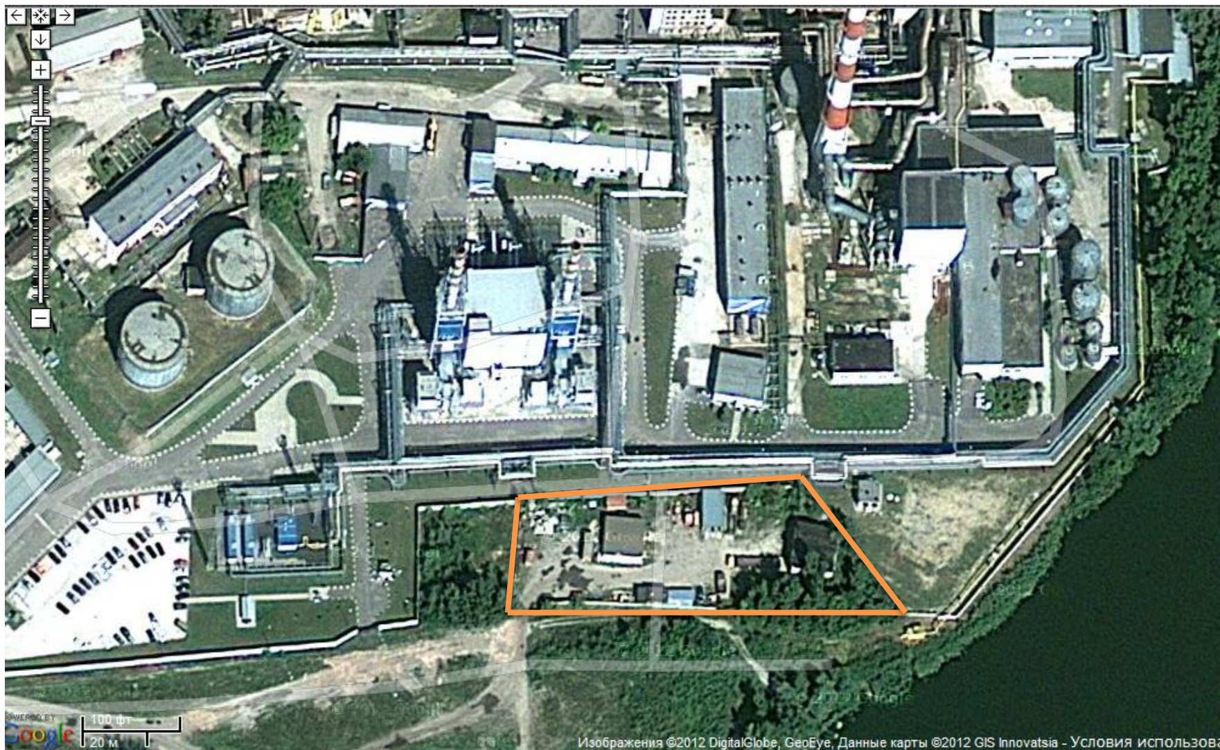
Схема территории базы